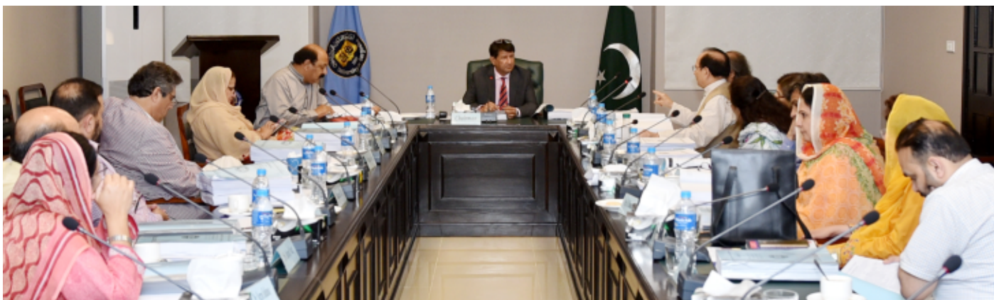
The Vice Chancellor presiding over the Syndicate meeting