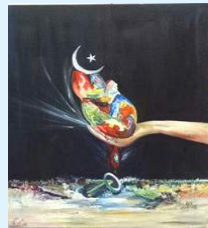
Award winning paintings